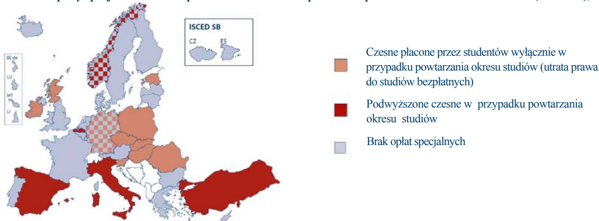
Rysunek 2: Opłaty specjalne wnoszone przez studentów za nieuprawnione przedłużanie okresu studiowania (ISCED 5), 2005/06

Piętnaście krajów pobiera wyższe opłaty (lub tam, gdzie nie ma czesnego, w ogóle je pobiera) od studentów powtarzających rok lub przedłużających naukę. Wysokość pobieranej kwoty pozostaje zwykle do decyzji danej uczelni, choć w kilku krajach jest regulowana centralnie. Patrz: Rysunek 2.